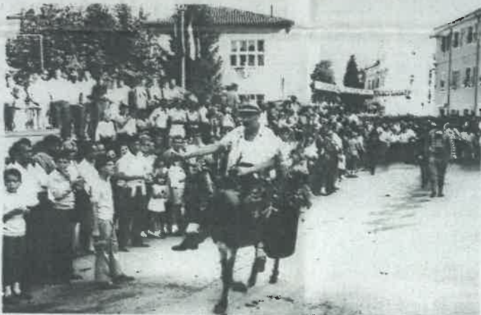
Dani grožđa imaju bogatu tradiciju - s jedne fešte šezdesetih godina